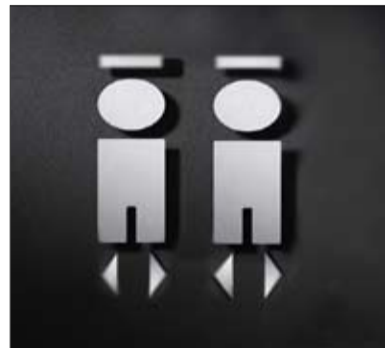
Konfessionen in Kooperation und im Dialog

len Schülerinnen und Schülern die Teilnahme an einem Religionskurs zu ermöglichen. Es können bis zu 50 % Teilnahme am Unterricht der anderen Konfession eingebracht werden. Wenn aber kein Religionsunterricht der eigenen Konfession erteilt wird, kann durch Teilnahme ausschließlich an der anderen Konfession die Abitursprüfung abgelegt werden. Dann entfällt in Zukunft in diesen Fällen die Abmeldung vom Religionsunterricht der eigenen Konfession.