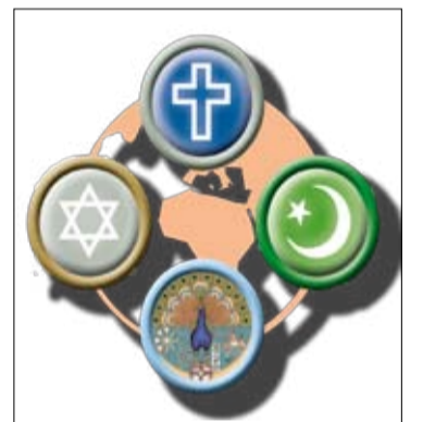
Logo des Fachtages: „Was können Religionen zur Prävention beitragen?“ im Mai 2011 in Oldenburg

Mit diesen Forschungsergebnissen sei es erwiesen, dass für Jugendliche die wichtigste Informationsquelle zu Religionen und Weltanschauungen in der Regel die Familie, gefolgt von der Schule ist. Es müsse - so die Verfasser - eine Transformation von passiver Toleranz, die vom Wissen geprägt ist, zu einer aktiven und praktischen Toleranz führen. Das erfordert aber ein Methodentraining