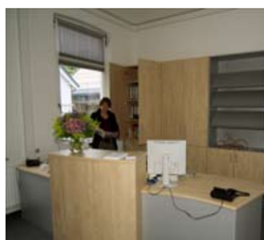
Die Medienstelle präsentiert sich in neuen Farben und zeitgemäßer Ausstattung.

Mehrere Wochen lag die gesamte arp unter einer Staubschicht und die Arbeit wurde durch